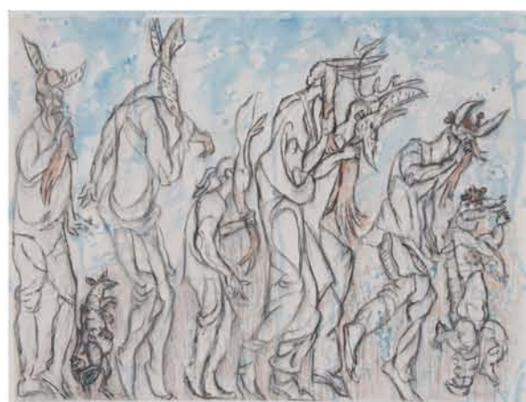
Shinzaburo Takeda "Tono"