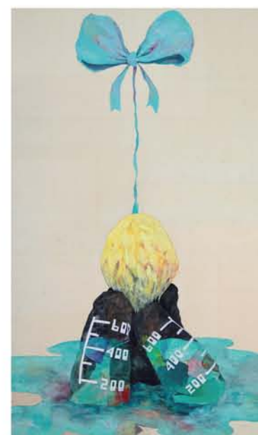
Hiroaki Iwahori "No llores"