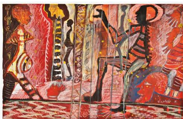
Baltazar Castellano Melo "Vómito"