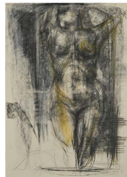
Aguri Uchida "Dibujo"