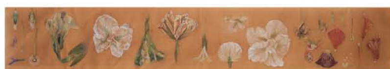
Misato Takagi "La flor 1"