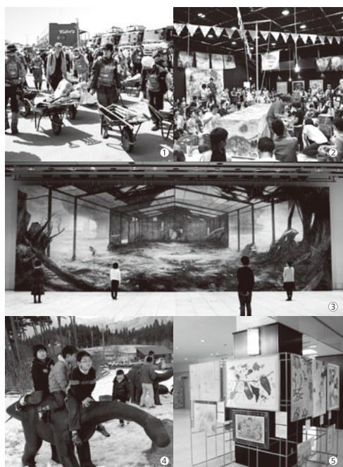
①支援活動/宮本武典 ②荒井良ことふらっくしっぷ/宮本武典 ③「雪に包まれる被災地」高さ5.4m×幅16.4m/加川広重 ④ 恐竜親子/西田光男 ⑤石巻支援アート押しプロジェクト/林家たい平