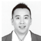
林家たい平 (はやしやたいへい) *映像出演

CMディレクター(株)東北新社取締役。武蔵野美術大学校友会会長、大学評議員、視覚伝達デザイン学科客員教授/1959年福岡県生まれ大阪育ち。視覚伝達デザイン学科卒。デジタル技術を駆使した娯楽性の高いCMの演出で数々の賞を受賞。主な作品に日清カップヌードル「hungry?」、サントリー「燃焼系アミノ酸」、サントリー「伊右衛門」、資生堂「新しい私になって」、NTTドコモ「渡辺謙シリーズ」、NHK「てっぺん」オープニングなどがある。2010年劇場用映画「矢島美容室the movie」を監督。