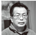
蛭田憲一 (ひるたのりかず)

落語家・芸術文化学科客員教授/1964年生まれ。1987年武蔵野美術大学造形学部視覚伝達デザイン学科卒業。1988年林家こん平入門。1993年NHK新人演技コンクール優秀賞受賞。2000年真打昇進。2008年第58回芸術選奨文部科学大臣新人賞受賞。ほか多数受賞。日本テレビ「笑点」、NHK「ど〜する?地球のあした」ほか出演。2011年「石巻支援アート押しプロジェクト」を企画実施。