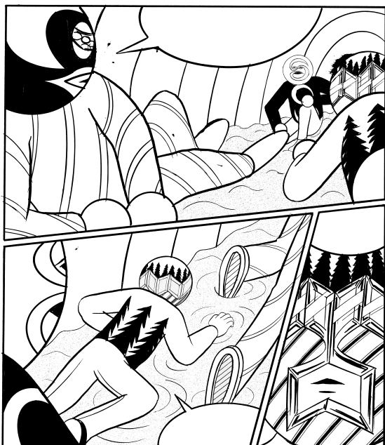
『ファッションと密室』より「砂場2」