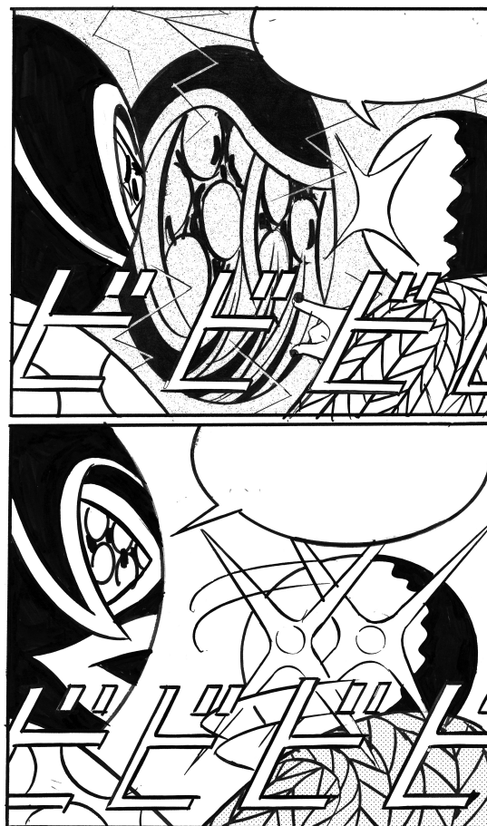
『ファッションと密室』より「砂場1」