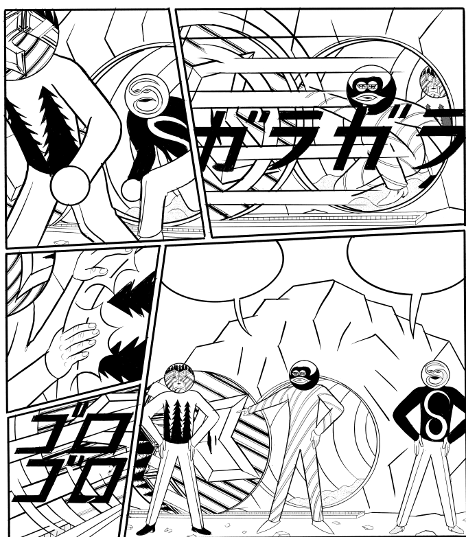
『ファッションと密室』より「砂場2」