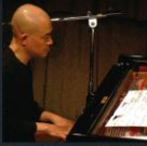
河合 拓始 (かわい たくじ)

東京生まれ。1995年『二重の鍵』で第16回入野賞受賞。90年代以降、反復もの、句読点、語りもの、伸縮ものなどの複数の路線を往還しながら作曲を続けている。作品は国内外で演奏、放送され、美術、映像、舞台など他ジャンルとのコラボレーションも行っている。