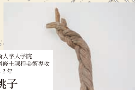
武蔵野美術大学大学院 造形研究科修士課程美術専攻 彫刻コース2年