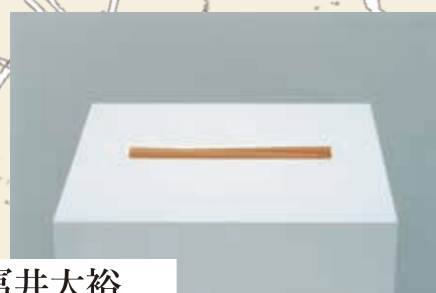
富井大裕 TOMII Motohiro