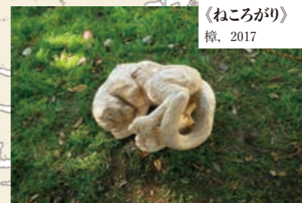
武蔵野美術大学 造形学部彫刻学科4年