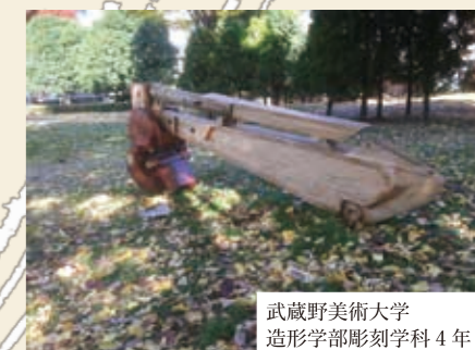
武蔵野美術大学 造形学部彫刻学科4年