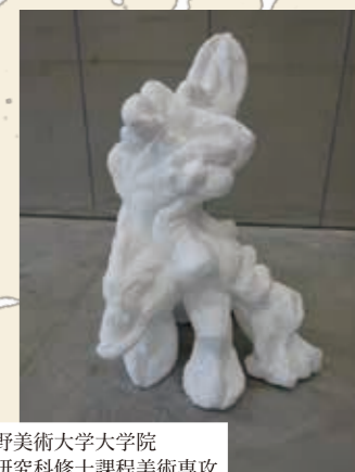
武蔵野美術大学大学院 造形研究科修士課程美術専攻 彫刻コース1年