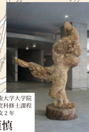
東京芸術大学大学院 美術研究科修士課程 彫刻専攻2年