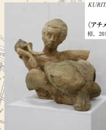
武蔵野美術大学 造形学部彫刻学科4年