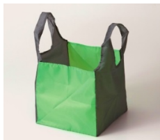
底が正方形でたっぷり入ります