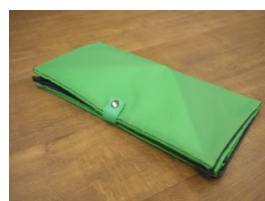
更に半分にたたんでスッキリ