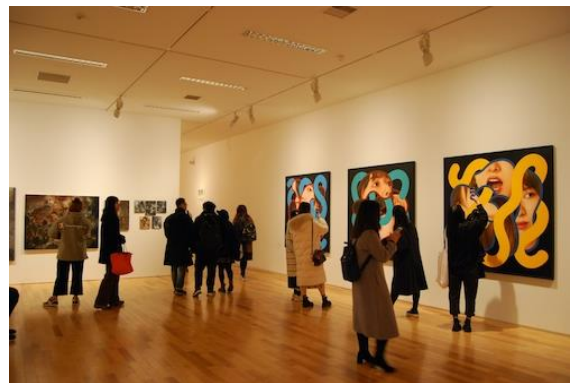
令和元年度 武蔵野美術大学 卒業・修了制作展の様子