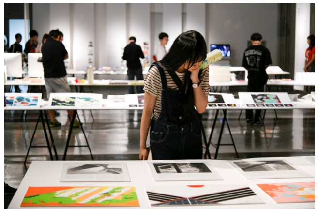
2019年度オープンキャンパスの会場風景