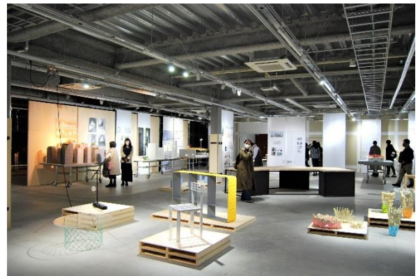
令和二年度 武蔵野美術大学 卒業・修了制作展の様子