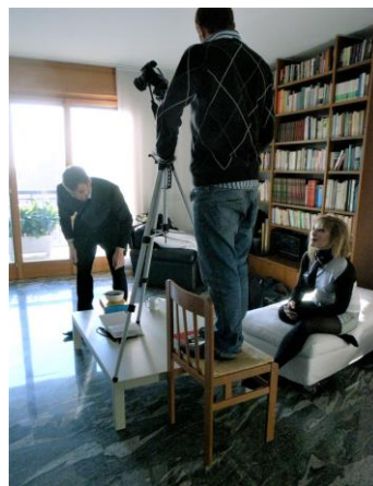
グループワークの様子