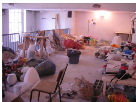
技法クラスのアトリエ