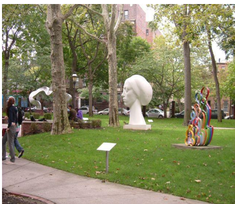
芸術作品が点在する大学構内

1887 年に産業人で慈善家であるチャールズ・プラット氏が実践的職業教育を目的として設立した大学である。マンハッタンとブルックリンにキャンパスをもち、創設以来アメリカのクリエイティブ産業に多くの人材を送り出している。近年、「アメリカのデザイン・建築大学ランキング」で、インダストリアルデザイン、インテリアデザイン及び建築分野が高評価を受けた。本学からの交換留学生はアート&デザイン学部の 3 年生として、コーディネーターと相談のうえ履修科目を決定する。現地の学生と同様に 1 年間に 24 単位以上 (1 学期に最低 12 単位) を履修する必要があるため、授業や課題等で大変忙しい留学生活が予想され、また、十分な英語力が必要とされる。