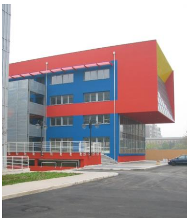
ポビザキャンパス

国立工学系大学として 1863 年に創立され、著名な建築家・デザイナーを多数輩出してきた名門校。7つのキャンパスを有し、市場の需要や社会状況の変化に対応しうる実践的で革新的な教育の提供に定評がある。ヨーロッパの諸大学とはもちろんのこと、北アメリカから東南アジアまで様々な国の大学と協定を結び、学生交換等を積極的に行っている。協定留学生はデザイン学部1年生～3年生の授業の中から受講科目を決定する。大学院生は大学院の授業を選択可能。(学部授業はイタリア語、大学院授業は英語で行われる。)