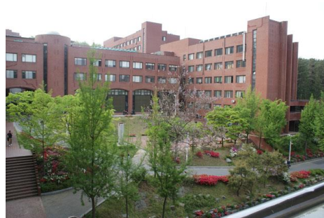
セジョン キャンパス