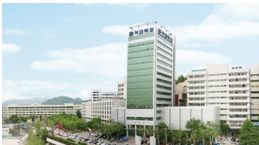
ソウルキャンパス

1946 年創立の 10 学部を擁する総合大学。美術学部には絵画、東洋絵画、版画、彫刻、視覚伝達デザイン、ID、テキスタイル・アート、木工・家具デザイン、セラミック、金属工芸、芸術学の 11 学科がある。映像関係はデザイン・美術学部に属している。英語での授業は全体の 1 割ほどしかないため建築学部は特に韓国語が必要になる。大学周辺は「弘大エリア」として知られる繁華街となっている。