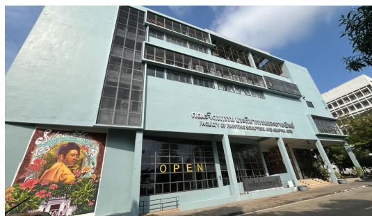
サナムチャン宮殿キャンパス