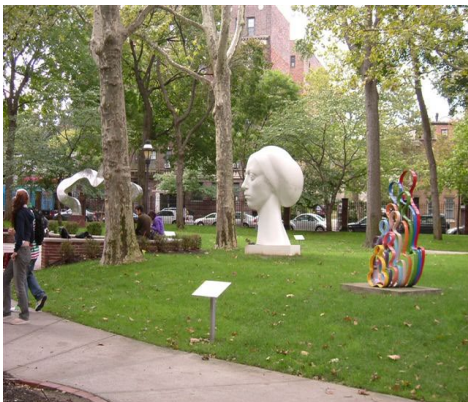
芸術作品が点在する大学構内

1887年に産業人で慈善家であるチャールズ・プラット氏が実践的職業教育を目的として設立した大学である。マンハッタンとブルックリンにキャンパスをもち、創設以来アメリカのクリエイティブ産業に多くの人材を送り出している。近年、「アメリカのデザイン・建築大学ランキング」で、インダストリアルデザイン、インテリアデザイン及び建築分野が高評価を受けた。本学からの交換留学生は学部の3年生として、コーディネーターと相談のうえ履修科目を決定する。現地の学生と同様に1年間に24単位以上(1学期に最低12単位)を履修する必要があるため、授業や課題等で大変忙しい留学生活が予想され、また、十分な英語力が必要とされる。