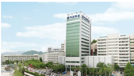
ソウルキャンパス

1946 年創立の 10 学部を擁する総合大学。美術学部には絵画、東洋絵画、版画、彫刻、視覚伝達デザイン、ID、テキスタイル・アート、木工・家具デザイン、セラミック、金属工芸、芸術学の 11 学科がある。映像関係はデザイン・美術学部に属している。英語での授業は全体の 1 割ほどしかないため建築学部は特に韓国語が必要になる。また、大学院生の場合は韓国語で授業を受けられるレベルの語学力が要される。大学周辺は「弘大エリア」として知られる繁華街となっている。