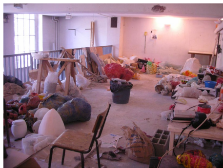
技法クラスのアトリエ