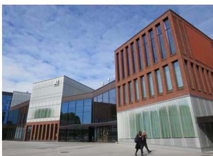
オタニエミキャンパス

学部の授業は原則フィンランド語で行われ、大学院の授業は英語で行われるため交換留学生は大学院に在籍となる。学部の中では唯一 Design のみ英語で行われる。建築専攻については、大学院生のみ応募可能。