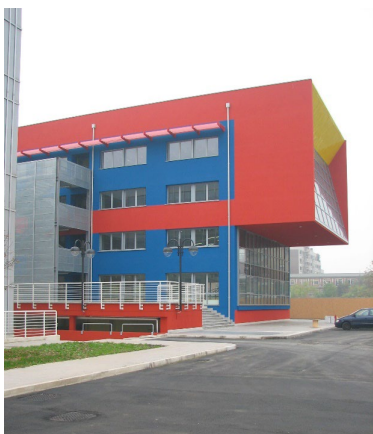
ポビザキャンパス

国立工学系大学として 1863 年に創立され、著名な建築家・デザイナーを多数輩出してきた名門校。7つのキャンパスを有し、市場の需要や社会状況の変化に対応しうる実践的で革新的な教育の提供に定評がある。ヨーロッパの諸大学とはもちろんのこと、北アメリカから東南アジアまで様々な国の大学と協定を結び、学生交換等を積極的に行っている。協定留学生はデザイン学部1年生～3年生の授業の中から受講科目を決定する。大学院生は大学院の授業を選択可能。(学部授業はイタリア語、大学院授業は英語で行われる。)