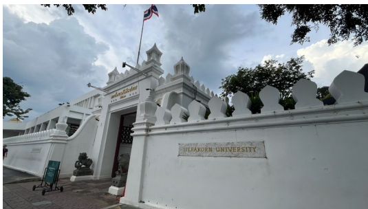
タープラ宮殿キャンパス

シラパコーン大学 (Silpakorn University : SU) の前身は、1933 年設立の美術学校 (School of Fine Arts) で、1943 年に「シラパコーン大学」として創立した。タイの美術系学部を有する大学としてトップに位置する。美術、デザイン、建築など芸術系の多彩なプログラムを有する。創立以来、美術教育の中心的存在として発展し、実践的な制作環境や文化施設に近い立地を活かし多くの著名アーティストを輩出している。キャンパスは、学科により最寄り駅が異なり、バンコクにあるタープラ宮殿キャンパスの他、ナコーンパトム県にはサナムチャン宮殿キャンパスがある。