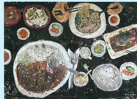
みんなが見ている絵:はらべこめがね(ああ、たのしや。)

小学校で続けてきた朝鑑賞が、保育園にも広がっています。絵を見ておしゃべりする積み重ねが、“自分の気持ちを伝える力”や“人の話を聞く力”、“答えのない問いを楽しむ力”を、遊びの中で育てます。小学校への入学前に、授業に近い体験をしておくことで、「これ、やったことある!」という安心感も生まれます。保育園での朝鑑賞は、子どもたちの学びをやわらかくつないでいます。