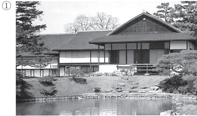
宮内庁京都事務所